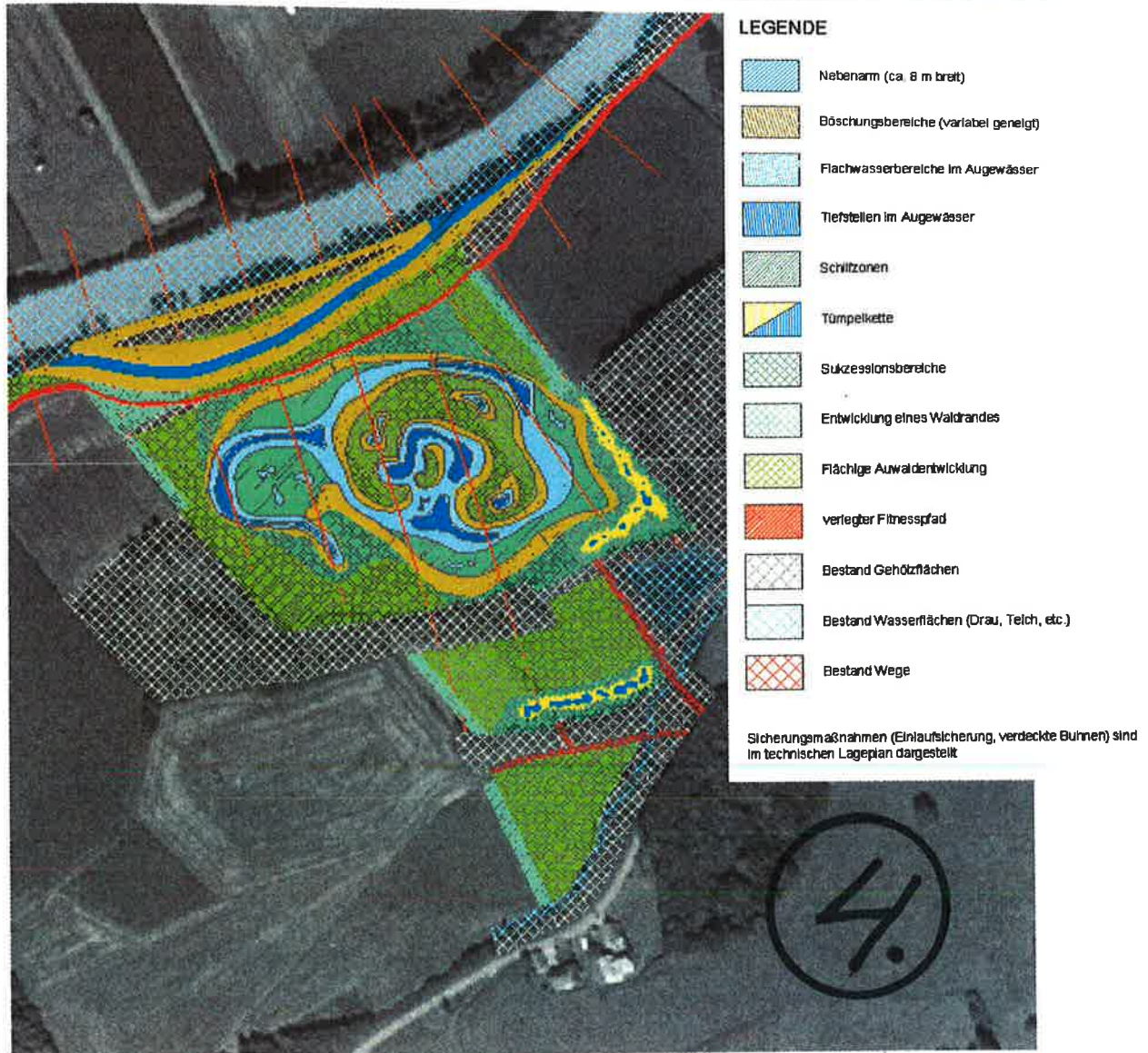
Abbildung 4-3: Planung der Ersatzmaßnahme Fellbach