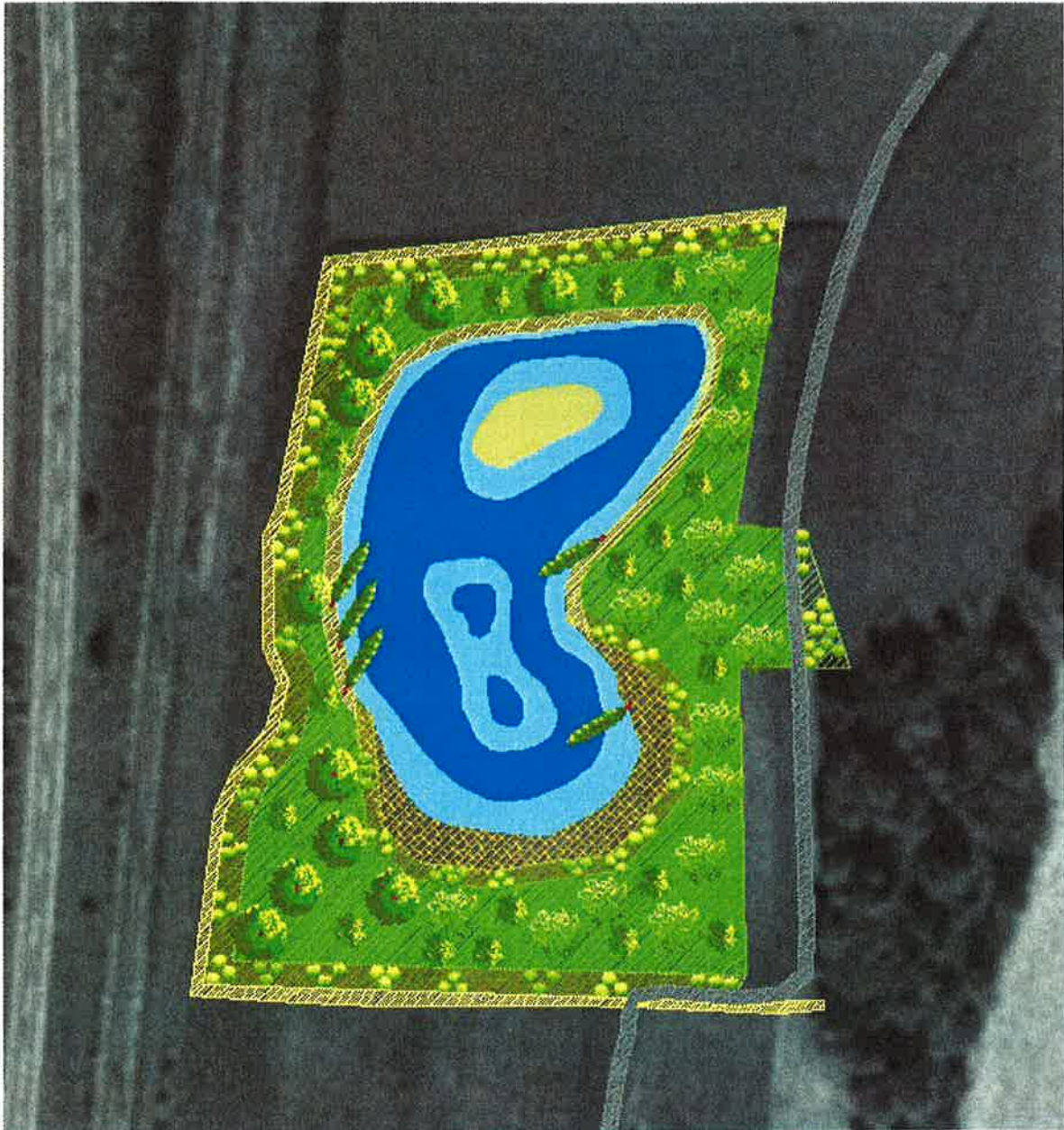
Abbildung 4-5: Überblick über die gesetzten bzw. geplanten Maßnahmen bei der Ersatzmaßnahme Obergottesfeld